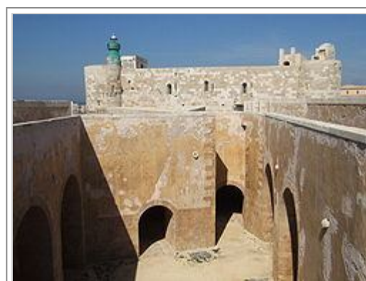
Interno del castello

Anche i dati costruttivi accrescono i dubbi. Manca infatti il baglio, cioè la piazza d'arme, quello spazio interno che consentiva le manovre delle macchine da guerra, le ingombranti catapulte, o trabucchi, destinate a lanciare pietre o altro. Né l'interno viene in nostro soccorso, in quanto vi è una grande sala ipostila, cioè piena di crociere e di colonne che ha soltanto nel modulo centrale un prezioso cortile ma che non ha niente a che vedere con lo spazio di manovra. Le torri stesse, ingombrate all'interno dalle scale, non potevano servire a scopi difensivi. Inoltre l'assenza di strutture abitative, dei depositi per le derrate alimentari e per il munizionamento,