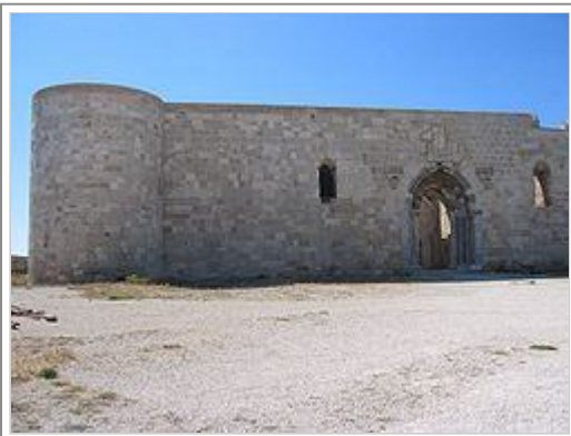
L'ingresso del castello.

Il Castello Maniace è uno dei più importanti monumenti del periodo svevo a Siracusa.